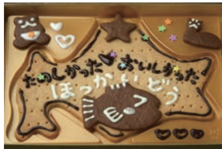
縦約 15cm× 横約 21cm

北海道型のクッキーにチョコペンで メッセージや絵を描き飾り付けをします お味はチョコレート又はバニラから お選びいただけます