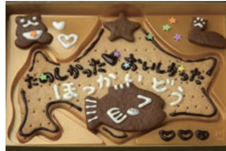
縦約 15cm× 横約 21cm

北海道型のクッキーにチョコペンで メッセージや絵を描き飾り付けをします お味はチョコレート又はバニラから お選びいただけます